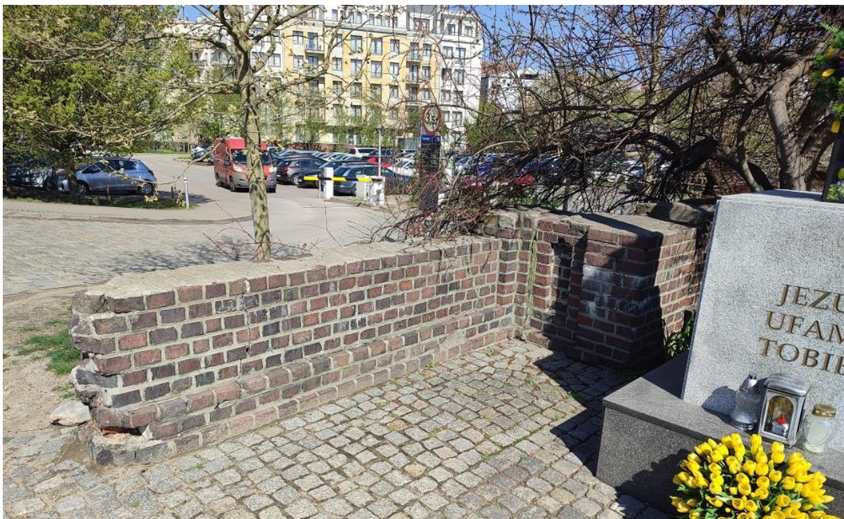
Fot nr 4 Fragment muru oporowego przy Krzyżu Chwaliszewskim.