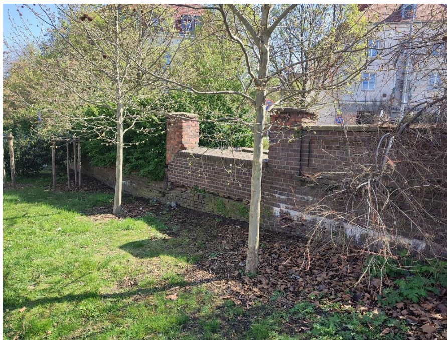
Fot nr 5 Mur oporowy od strony ulicy Wenecjańskiej.