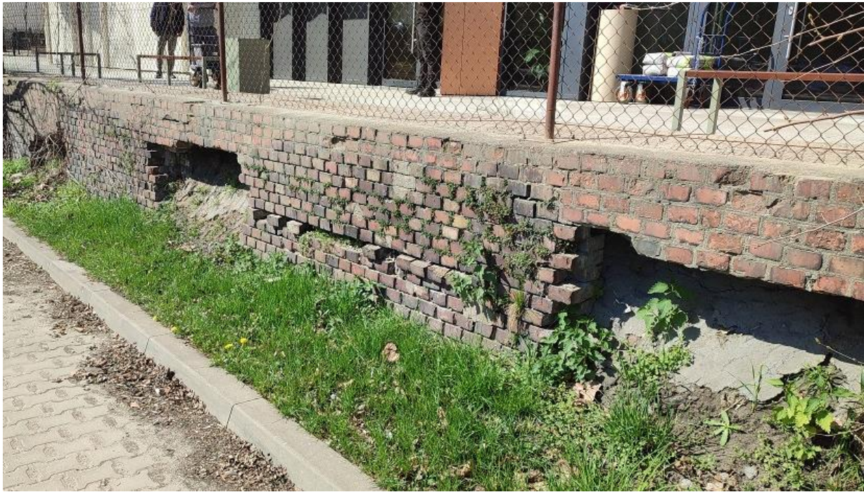
Fot. nr 3 Mur oporowy na granicy z kamienicą przy ulicy Garbary 68.