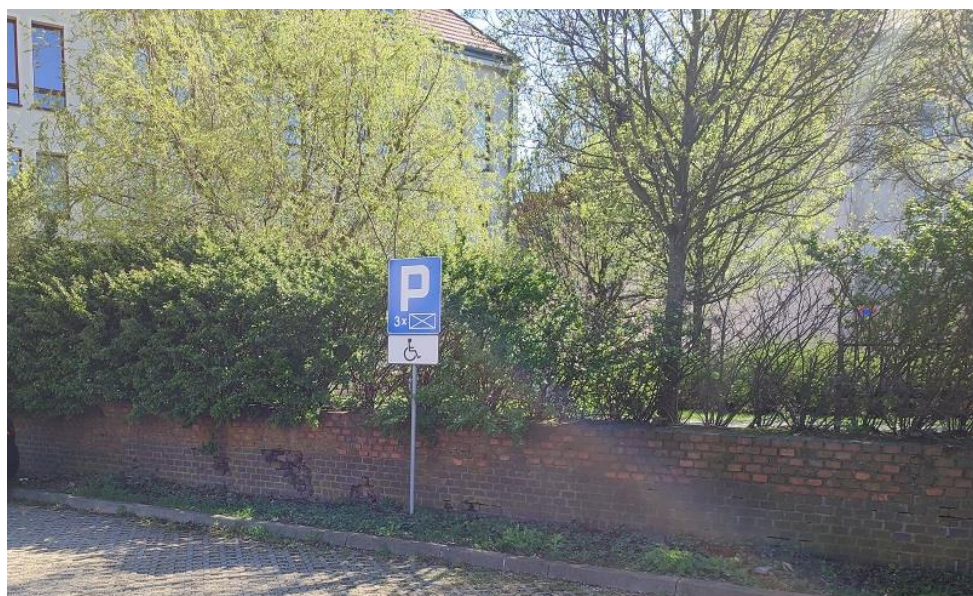
Fot nr 6 Mur oporowy od strony ulicy Wenecjańskiej.