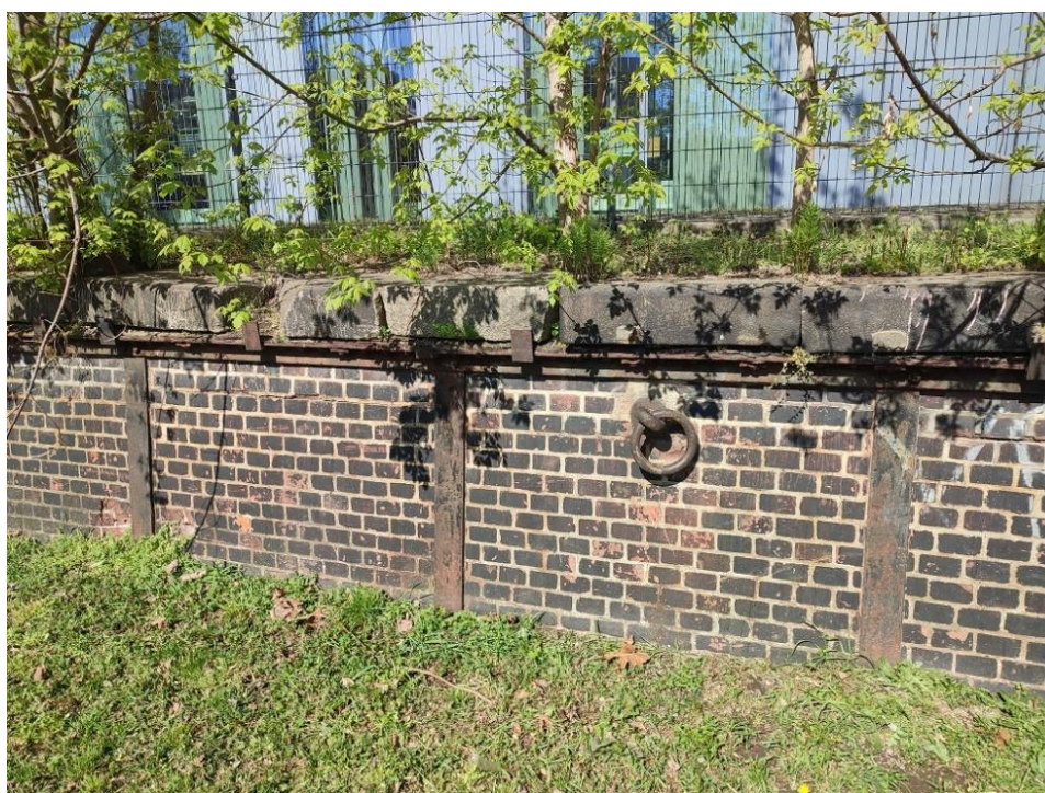
Fot. nr 2 Mur oporowy od strony ulicy Szyperskiej