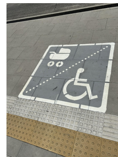
piktogram miejsce oczekiwania