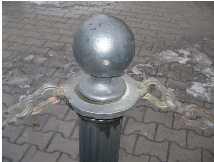
Sposób mocowania łańcucha