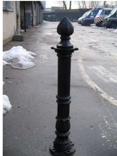
TYP Słupka Garbary