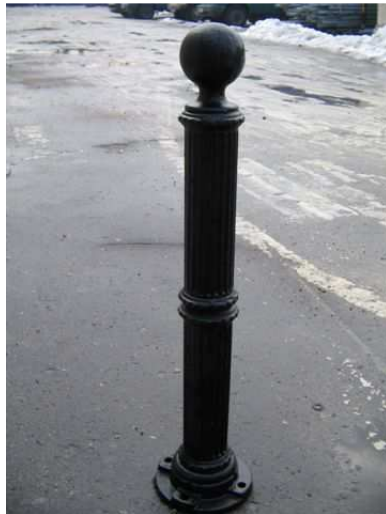
TYP Słupka Stary Rynek