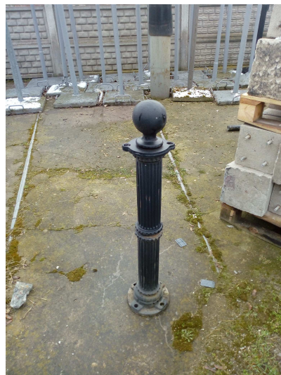
TYP Słupka Pułaskiego