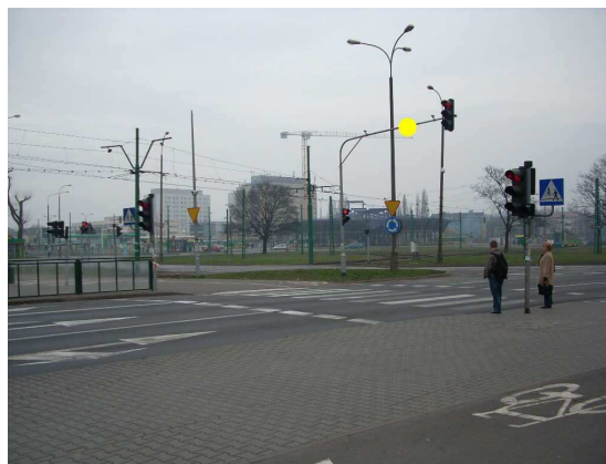
tabliczka Rpa2-lr-a1 (na rondzie)