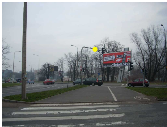
tabliczka Rpa2-Jr-a1 (na rondzie)